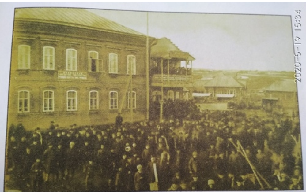
Здание волостного правления, в котором разместилась первая библиотека. 1903 г.