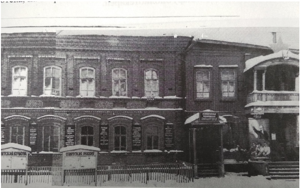
Здание районной библиотеки и РДК в 60-е г. г. XX века